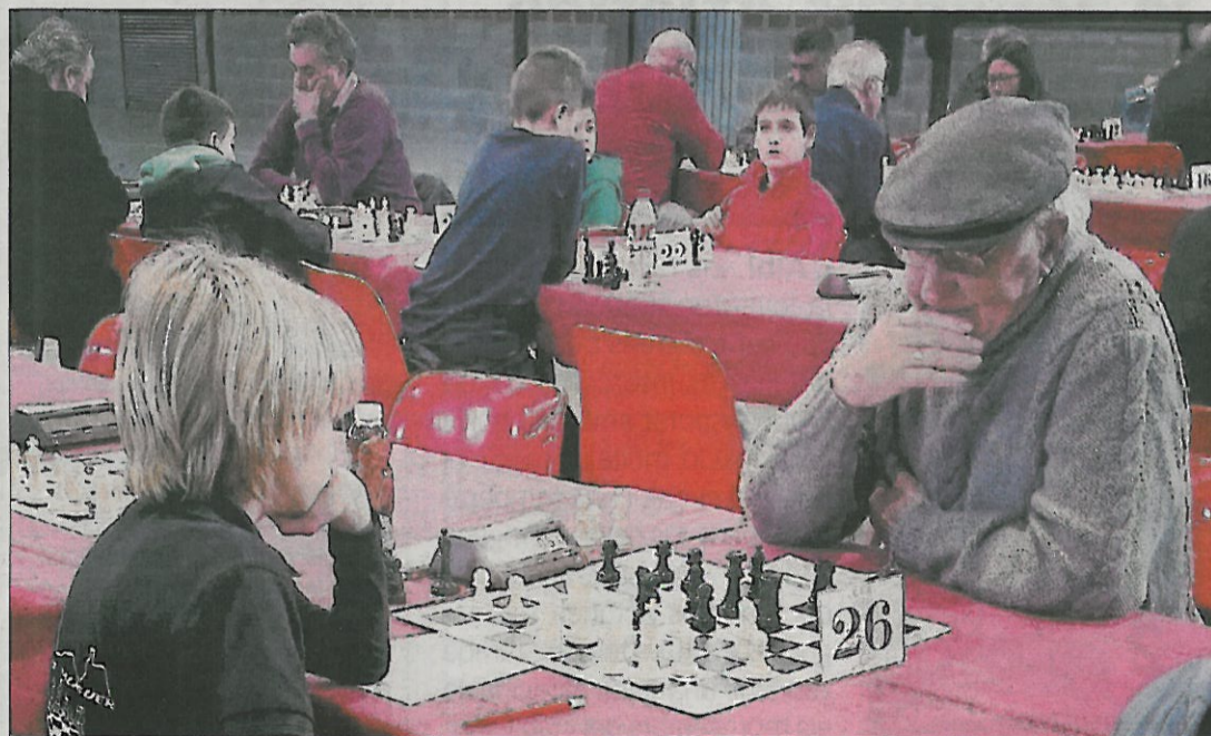
Una de les partides, sense límits d'edat, disputada al poliesportiu de Bellcaire.

Bellcaire. A falta de tres rondes per al final del campionat provincial absolut, Alejandro Barbero (Lleida) es perfila com a gran favorit a endur-se el títol després d'aconseguir taules davant dels fins ara màxim aspirant a la victòria final, David Monell (Vallfogona), que es queda despenjat. Segon és, ara mateix, Josep Argerich (Torà), a mig punt del primer classificat. Pel que fa al grup B, Àlex Ghenghiu (Pardinyes) es manté ferm en el liderat que defensa en solitari.