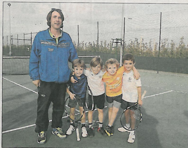
Equip del Club Natació Lleida B (esquerra), tercer en el Happy Meal, i equip del Club Tennis Lleida A, primer en la Lliga prebenjamí.