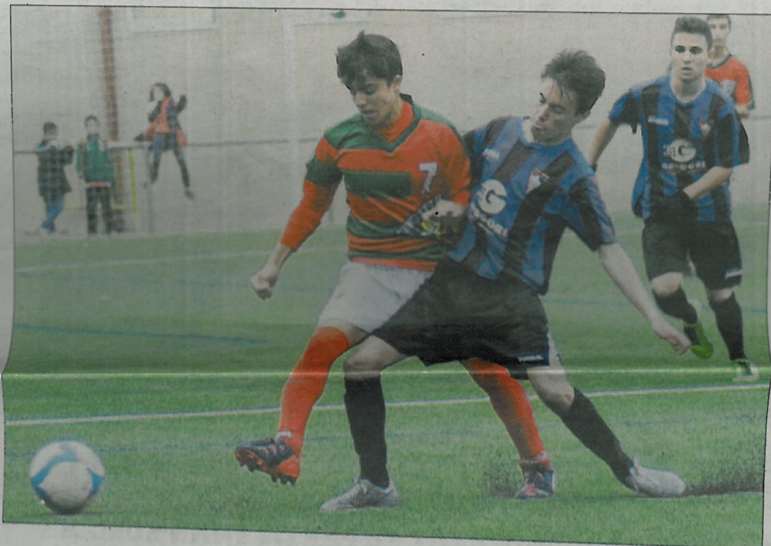
Bordeta i Atlètic Segre van oferir un derbi cadet d'allò més trepidant.