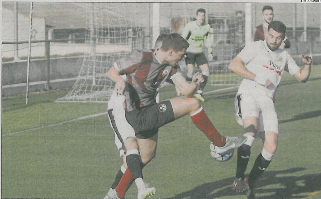
Varios defensores del Borges presionan a un jugador del Júpiter.