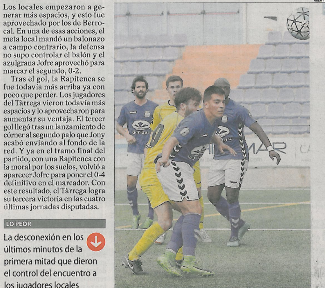
Tras la victoria, el Tàrrega suma 30 puntos, a diez del objetivo.

El Tàrrega dominó el partido desde el inicio y solo cedió el control del balón al rival en los últimos minutos de la primera parte.