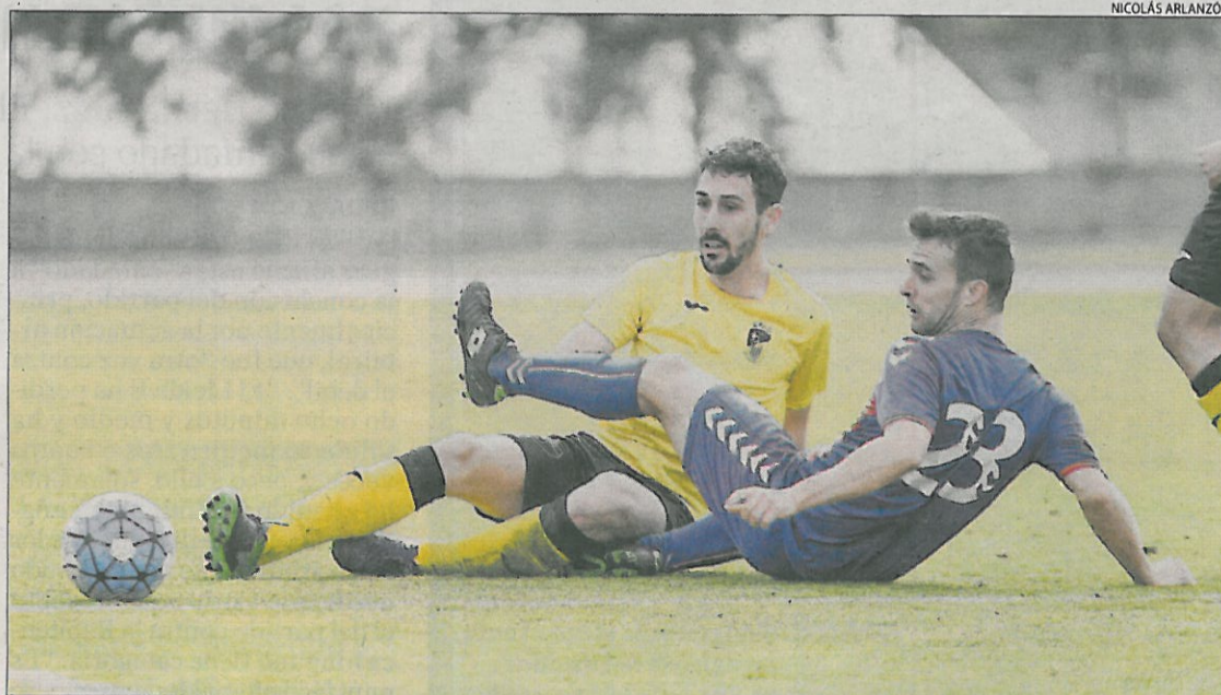
El Gavà se mostró más intenso que un EFAC que acabó encajando la segunda derrota seguida.