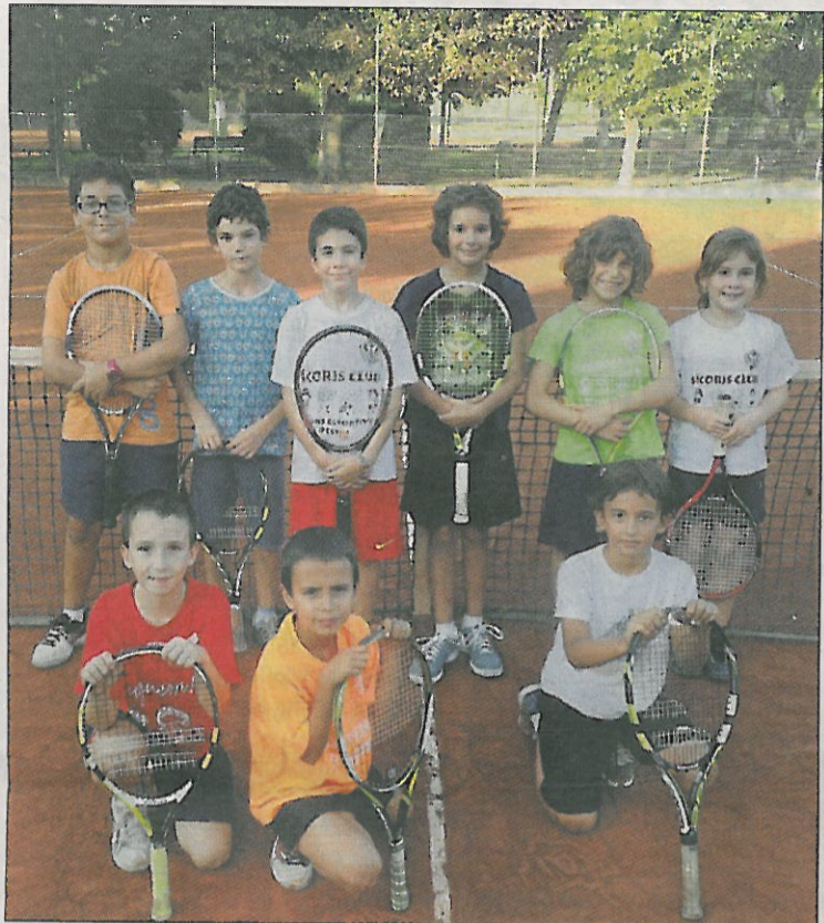
El Sícors participa en les dos categories i va segon.

Deu equips benjamins dividits en dos categories, que ja tenen els primers líders, en dos jornades disputades en el Tennis Lleida A, en el Grup Ronald, i el Mas Duran de Cervera, en el Happy Meal