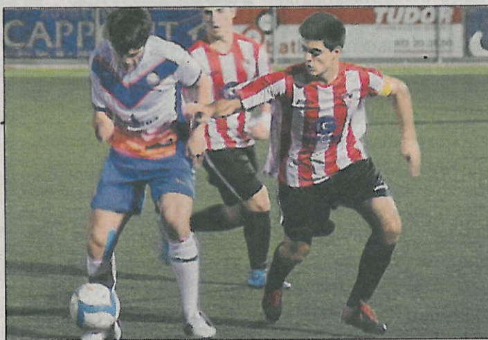
L'Atlètic segre no va tenir gens de sort a Terrassa.