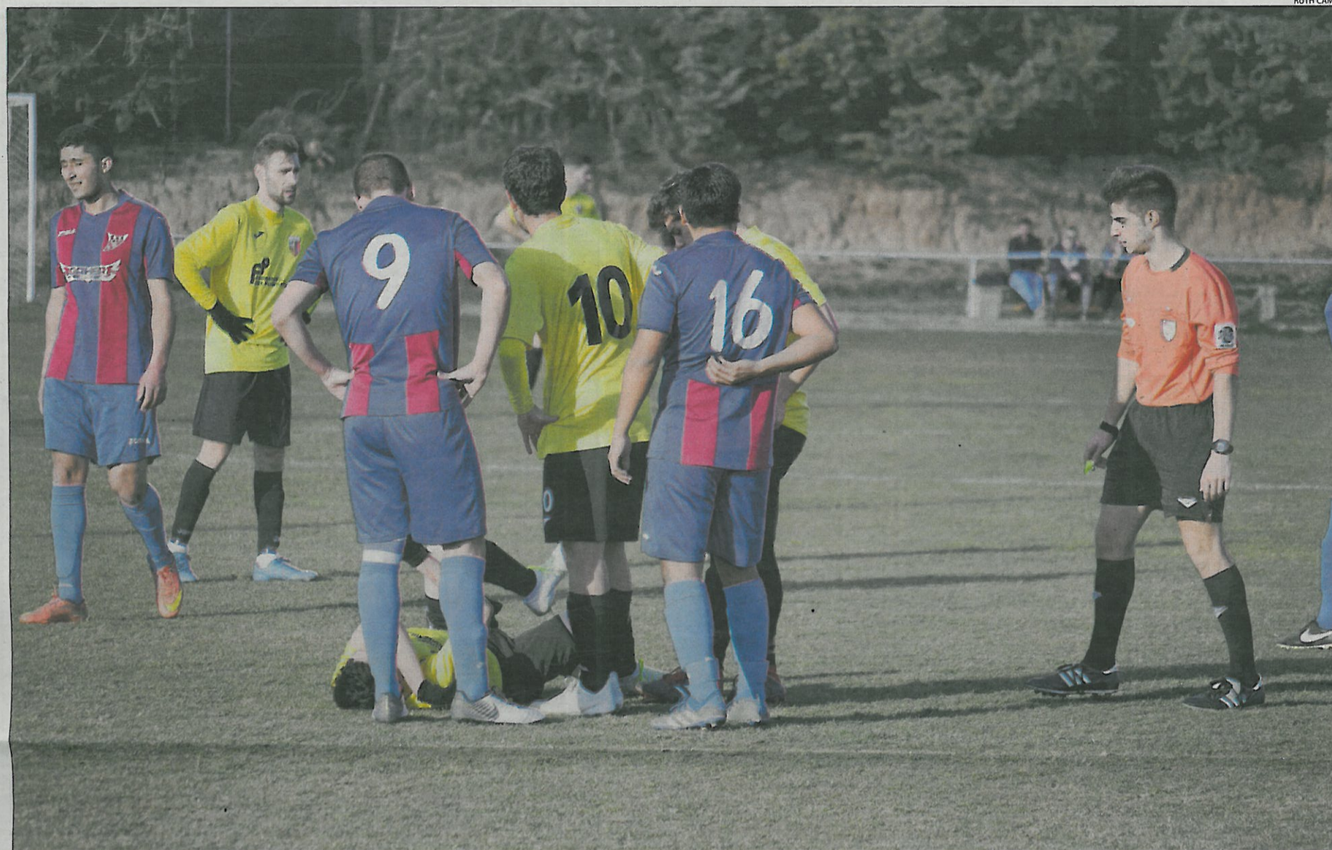
Un jugador lesionado del Juneda es rodeado por varios compañeros y rivales en presencia del árbitro del encuentro.