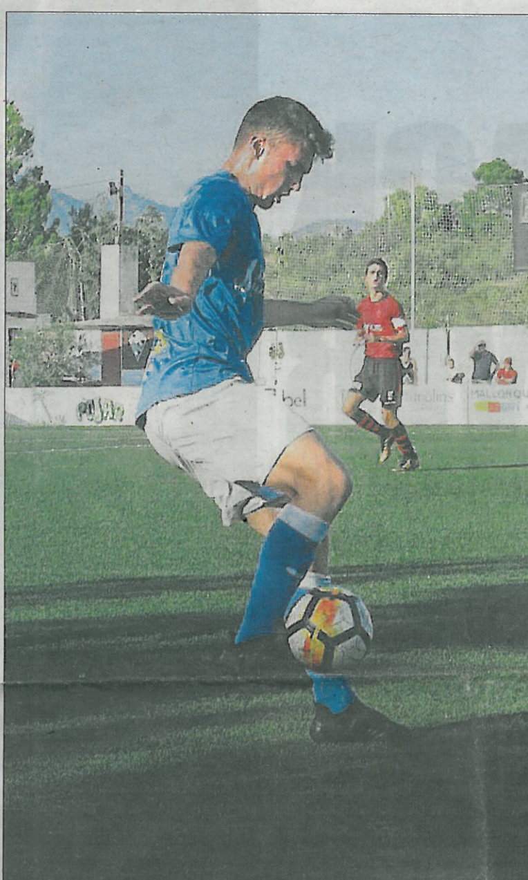
Empate Del Lleida en campo del San Francisco

Penalti y empate en el añadido A falta de dos minutos para el final del tiempo reglamentario, el colegiado decretó penalti a favor del Lleida. Los jugadores del San Francisco protestaron mucho la