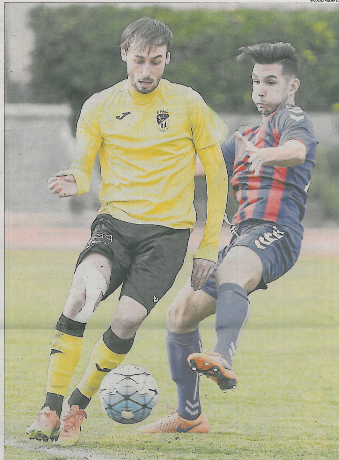
Un jugador del EFAC protege el balón ante la presión de un jugador del Gavà.