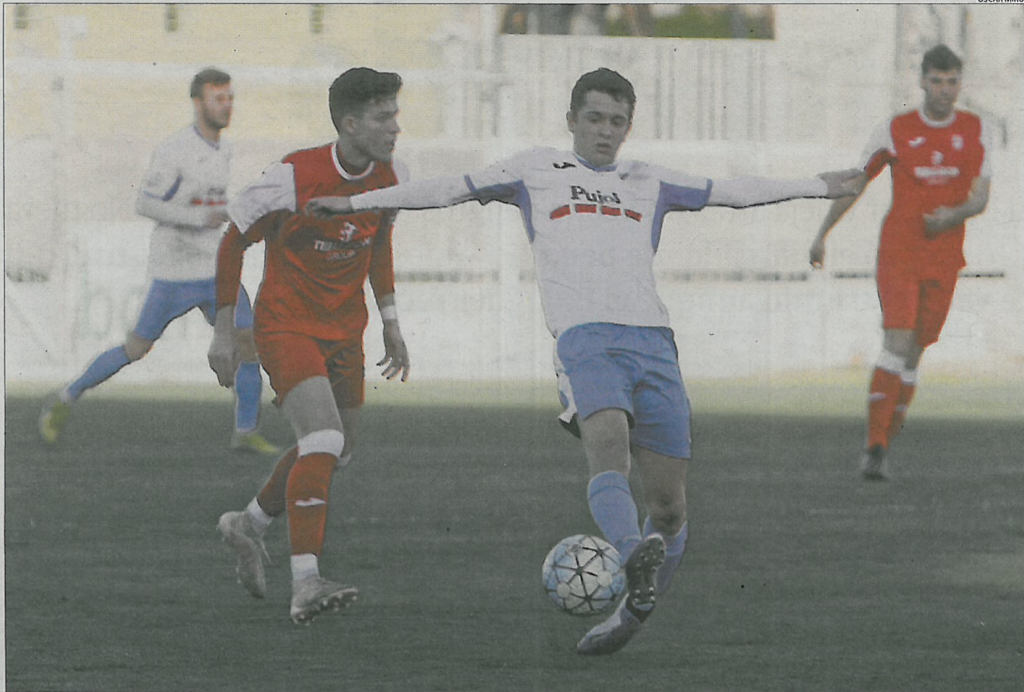
El Mollerussa jugó un buen primer tiempo, pero se desdibujó tras el descanso y acabó perdiendo (1-3).