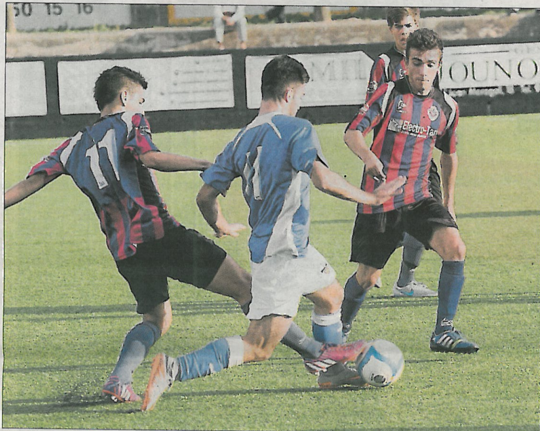
El Tàrrega va caure golejat al terreny de joc d'un efectiu Nàstic de Manresa.

Manresa. El Nàstic de Manresa va trencar amb la bona dinàmica del Tàrrega, que portava cinc jornades sense perdre i va caure del segon lloc de la taula, desaprofitant, a més, l'oportunitat d'apropar-se al liderat del Jàbac. No va saber trobar la seva millor versió el conjunt blaugrana, i des dels primers minuts va començar a anar a remolc dels locals. Als 6 minuts es va trobar amb el primer gol en contra i, a la mitja hora de joc, encaixava el segon gol, una diferència molt complicada de remuntar. Malgrat el 2-0, el Tàrrega ho va intentar a la segona meitat, en què va gaudir de nombroses ocasions per poder retallar diferències. Però el Nàstic va saber aprofitar les seves i Novoa marcava el tercer del seu compte particular als 59 minuts. Amb els blaugrana bolcats sobre la porteria rival, els manresans van sentenciar a la recta final.