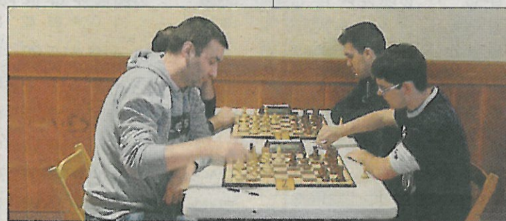
Una de les partides dels provincials a la Guàrdia.