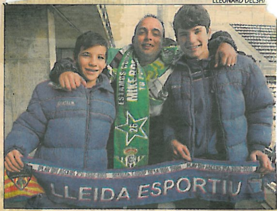
Una mostra de 'fair play' entre aficionats.