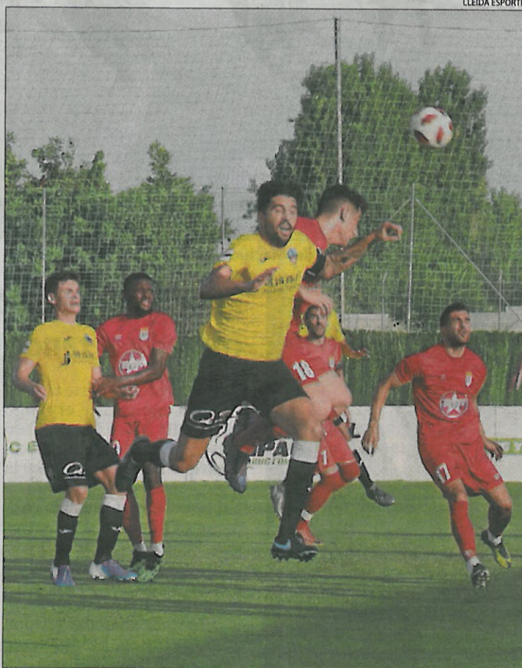
Los jugadores notaron las altas temperaturas de Málaga.