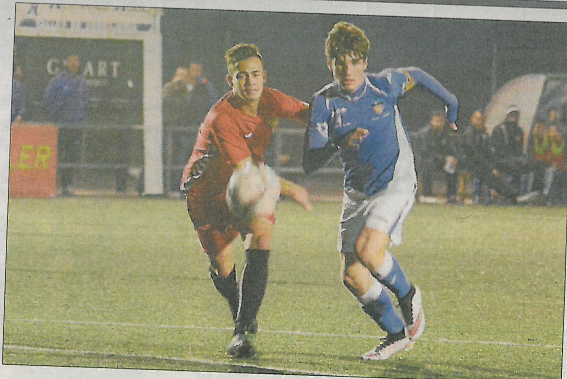
Els lleidatans van pagar molt cara la seua manca de definició al Municipal dels Magraners.

avançar-se al marcador. Però semblava que cap dels dos tingués bona punteria i així es va arribar al descans sense que es mogués el marcador. A la segona part, el ritme del partit va ser idèntic al del primer temps, però aquest cop els tarragonins van gaudir de més ocasions i, a més, les van saber aprofitar. Al minut 68 Torreblanca va encetar el marcador. Aquest gol va donar empenta a la confiança dels visitants i Moya va sentenciar el partit al minut 75. El Lleida ho va intentar, però ja no va tenir cap ocasió clara per intentar capgirar el resultat.