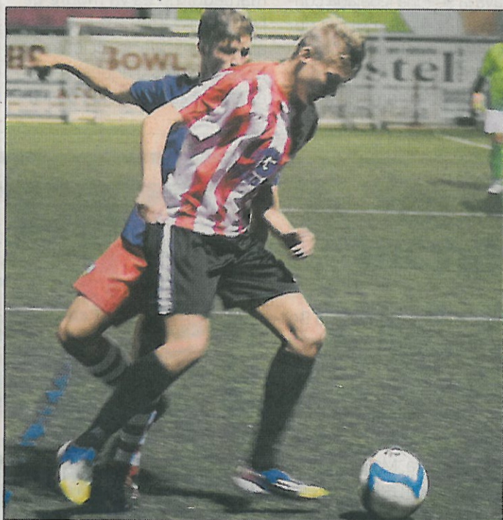
L'Atlètic Segre no ho va tenir gens fàcil a Cerdanyola.