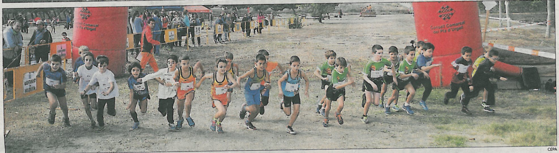
Dos de les sortides de les categories petites del cros dels Esbufecs, disputat en l'immillorable marc del Parc de la Serra, a Mollerussa.