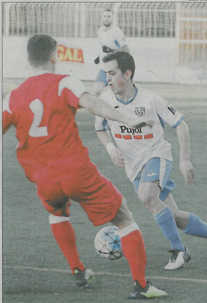
Un jugador del Mollerussa conduce el balón ante un rival.