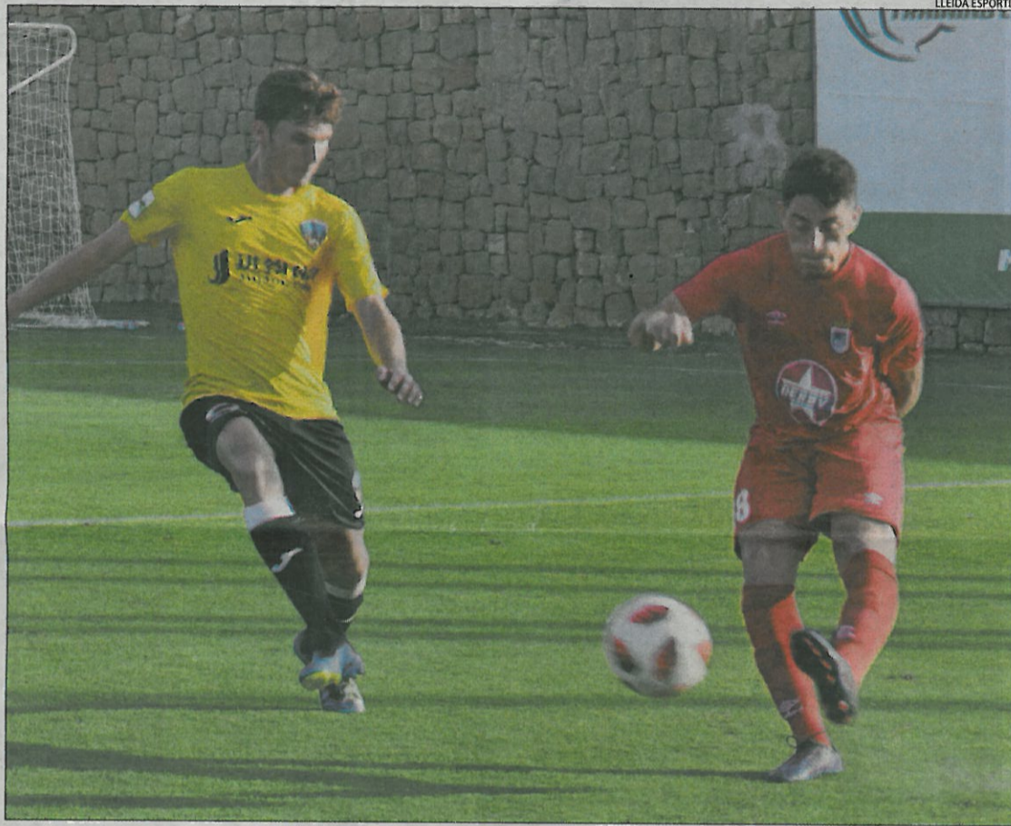
El Lleida Esportiu se estrenó ayer frente al Badajoz en las instalaciones del Marbella Football Center.