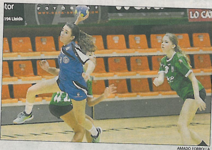
Un llançament a pals de l'Associació que va acabar en gol.

seues mans. El partit va ser molt entretingut, jugat de poder a poder i amb una destacada, la portera local, que va fer, com a mínim, cinc grans aturades al llarg del partit. Al final, la manca de sort en els llançaments, clau.