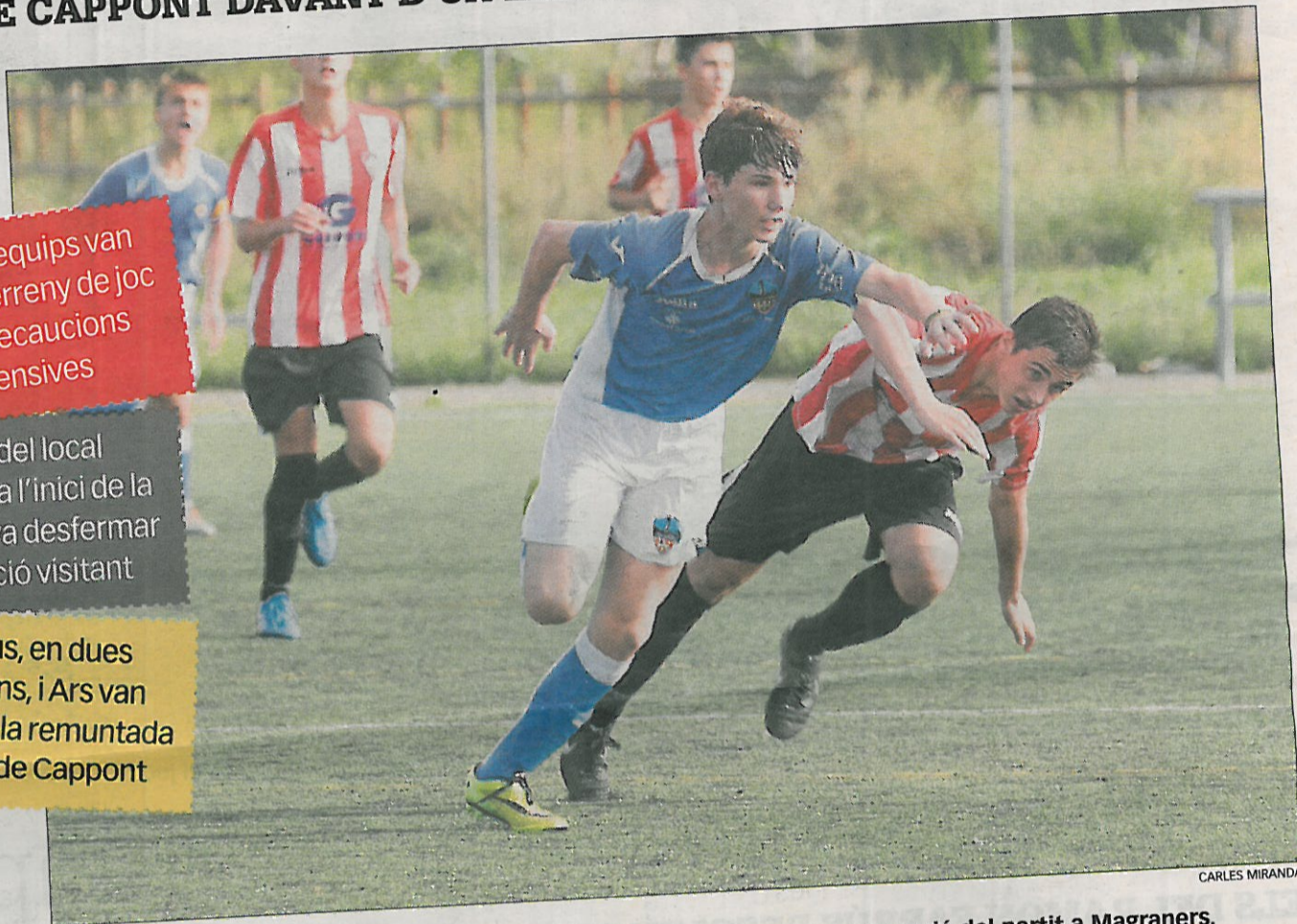
Un jugador del Lleida s'escapa del marcatge d'un de l'Atlètic Segre, en una acció del partit a Magraners.

Quibus, en dues ocasions, i Ars van culminar la remuntada per als de Cappont