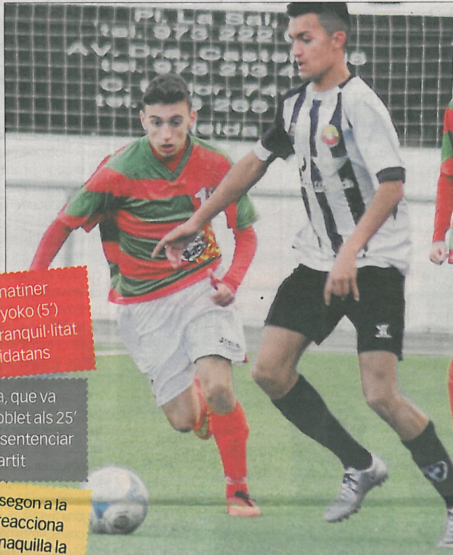
Un jugador del Bordeta en plena jugada d'atac.

El Jabac, segon a la Lliga, no reacciona i tan sols maquilla la derrota a la represa