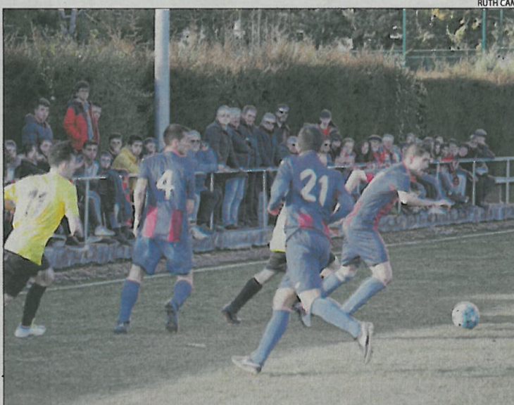
El partido fue intenso y atrajo a muchos aficionados.