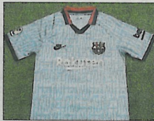
La tercera equipación.

El diseño de la nueva tercera camiseta del Barça para la temporada 2019-20 será de color celeste. En ella, los jugadores lucirán como de fondo el escudo de la ciudad de Barcelona. Este color lo empleó el Barça hace dos décadas, en la segunda equipación del club en las temporadas 1992-1993 y 1996-1997. En este último curso el equipo ganó la Recopa de Europa, con Ronaldo como jugador estrella del conjunto azulgrana.