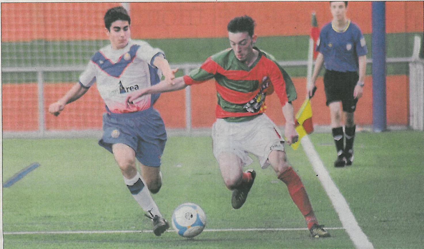
El Bordeta, en foto d'arxiu, va estar molt efectiu en atac al camp del Júnior.

Gols: 0-1, Vezhdi; 0-2, Bagayoko; 0-3, Espinosa i 0-4, Espinosa.