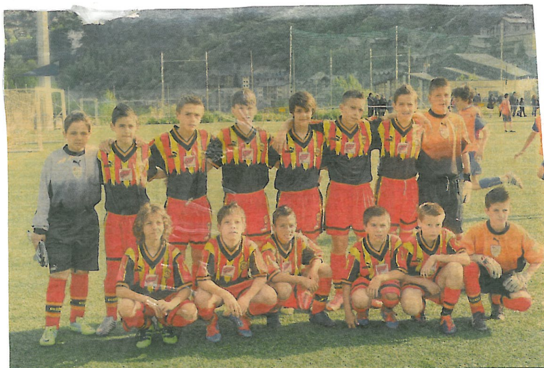
La selecció alevina de Lleida guanya el Memorial Francesc Vila d'Andorra