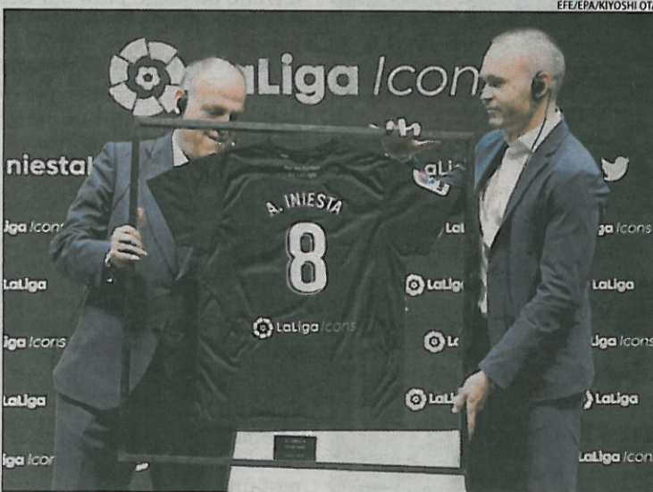
Javier Tebas entregó una camiseta a Andrés Iniesta.