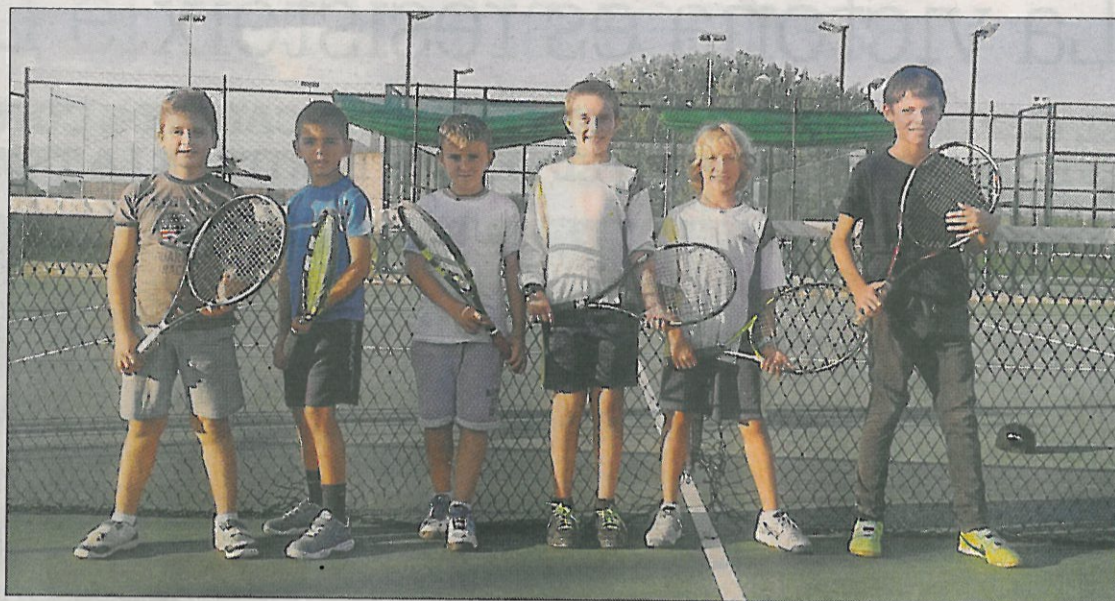
Equip del Mollerussa que participa en el grup Happy Meal del McDonald's 2014.

Un clàssic del tennis lleidatà que suma ja dotze edicions per a benjamins per equips