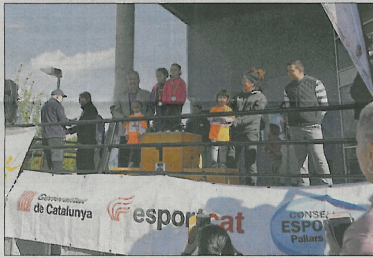
Una de les curses de la matinal i un dels podis petits a Tremp.