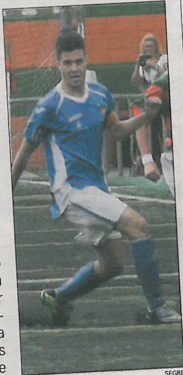
Un lleidatà, en foto d'arxiu.

va oferir una mostra del seu potencial ofensiu i defensiu. Els barcelonins no van donar cap tipus d'opció als seus rivals lleidatans, que de mica en mica van anar claudicant. La primera meitat va concloure amb un 0-2 (15' i 26') i la sensació que el partit, salvant les distàncies, seguia viu. Però dos gols més a l'inici del segon temps (41' i 48') el van acabar de matar. En la resta de minuts, l'Espanyol va arrodonir la golejada (0-6), mentre que els locals van intentar no perdre la cara al matx. Segona derrota seguida dels lleidatans.