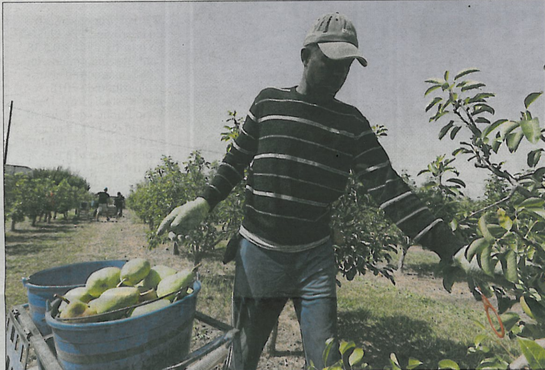
Un temporero recogiendo ayer peras Limoneras en una finca de l'Horta de Lleida.

Décadas atrás, la Limonera era una fruta que tenía como destino principal la exportación y era especialmente apreciada en Alemania. Paulatinamente ha ido perdiendo empuje en otros mercados y también se ha reducido el número de hectáreas destinadas a su producción. En parte por una reconversión varietal hacia otras peras, con especial empuje de la Conferencia. Pero también por