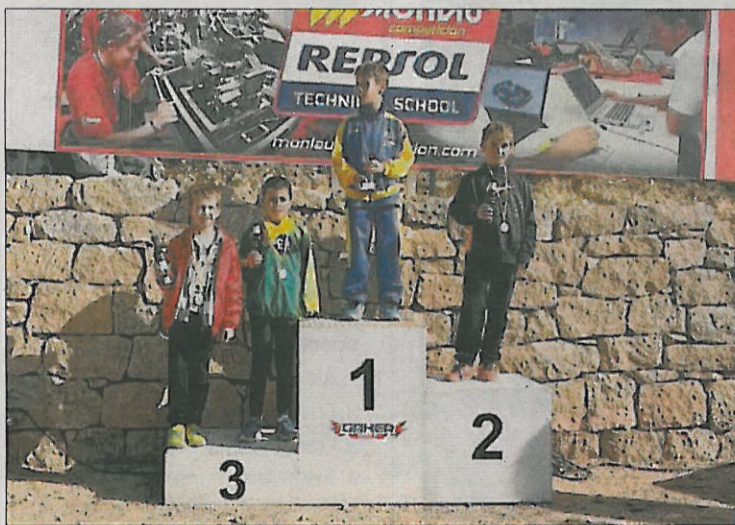
Un podi del cros de l'Albi amb presència targarina.