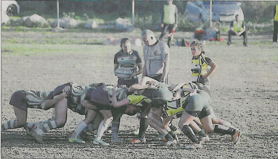
Una jugada del partit disputat a Sitges amb victòria lleidatana.