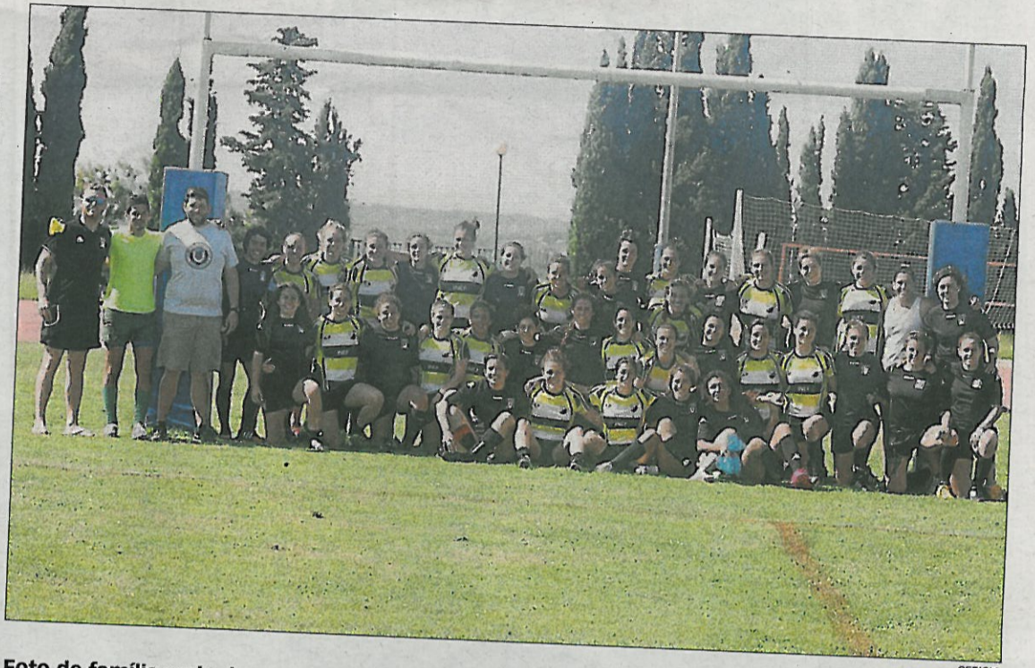
Foto de família amb els equips femenins de l'INEF Lleida i del BUC a la Caparrella.