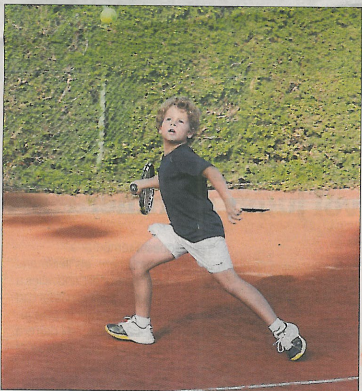
El nivell de tots els partits és força elevat.

Lleida. El Club Tennis Lleida A, en el grup Ronald, i el Centre Esportiu Mas Duran de Cervera, en el grup Happy Meal, són els primers líders, després de les dos primeres jornades disputades, d'una nova edició de la Lliga McDonald's de tennis per equips reservada a jugadors i jugadores en edat benjamina. Enguany hi participen un total de deu equips, dividits en dos categories (segons nivell i data de naixement), que disputen els seus encontres al millor de cinc partits i al millor de nou jocs amb quatre matxs individuals i un de doble.