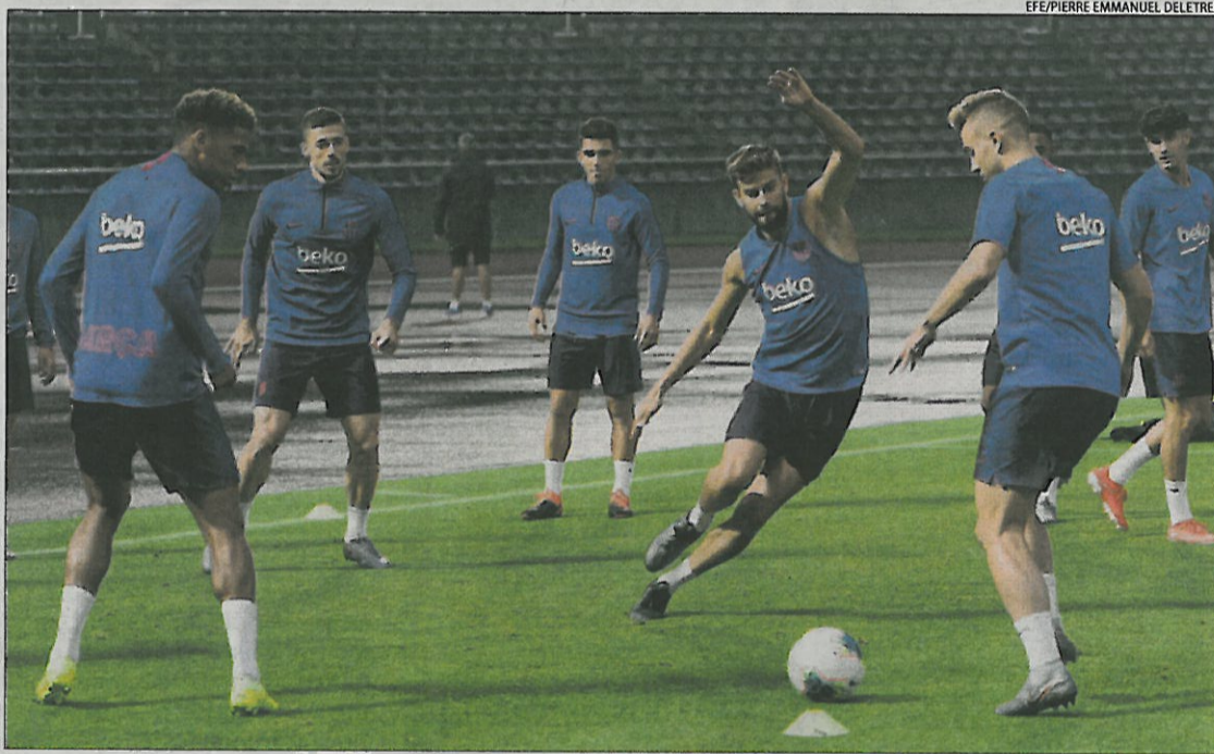
Gerard Piqué y sus compañeros se ejercitaron sobre el césped del Machida Stadium.